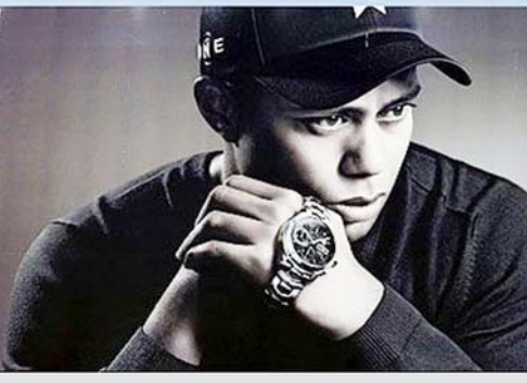
高球明星老虎伍茲的婚外情醜聞，不但讓他的聲譽掃地，高球生涯也因此無限期的停止，就連各家名牌的代言也都大受影響。圖為懸掛在美國洛杉磯的一處伍茲代言的名錶廣告看板，上方的一隻飛鳥似乎也意味著，這代言也因此飛走了。

【綜合報導】伍茲會離開高爾夫多久？對於他個人和高爾夫損失又是多少？《紐約郵報》昨做出評估，伍茲停賽1年就會少掉1.88億美元，和他相關的贊助商和高爾夫商業每年會蒸發5.91億美元以上。 《紐約郵報》將伍茲收入來源分成贊助代言、設計球場、高爾夫獎金與出場費3部分計算。贊助代言多為複數年合約，每年的金額只能推估，報導提及的數字來源是根據《富比世》(Forbes)雜誌今年計算出的每年1.18億美元。伍茲手頭現有3個球場設計工作，預計也將停止，這部分損失3000萬美元。 由於伍茲2008年因傷病缺席不少，計算基準是他最近完整賽季2007年，該年伍茲各大巡迴賽獎金收入約為2300萬美元，參加其他表演賽出場費約1700萬美元。